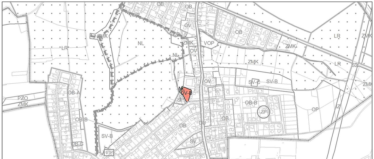
Návrh změny, výkres č. 4 – Plán využití ploch

Grafická část odpovídá metodice platného Územního plánu sídelního útvaru hl. m. Prahy, v souladu s § 188 odst. (1) stavebního zákona.